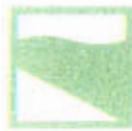
GRAFICO DELLE PRESTAZIONI ENERGETICHE GLOBALE E PARZIALI